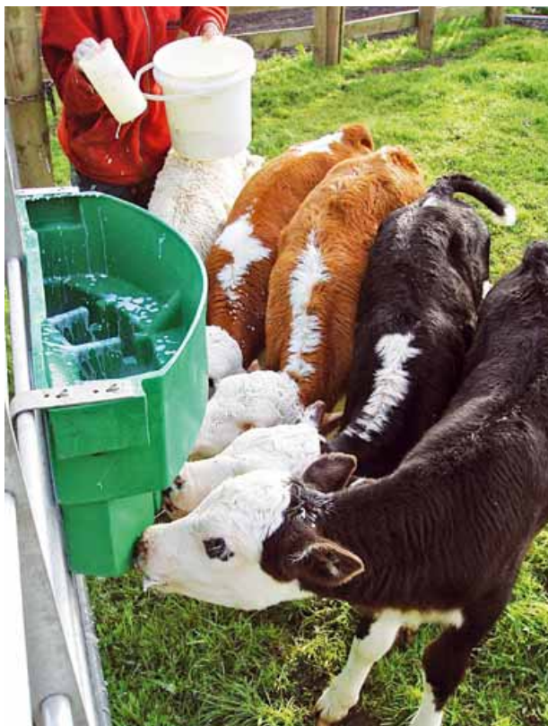
Nei concentrati per vitelli non è necessario utilizzare proteine del latte, ma equilibrare proteine vere e azoto non proteico

È l'alimento più adatto per la fisiologia dei vitelli sia esso materno sia sostituto. È ovvio che il latte naturale è ideale per i fabbisogni dei vitelli. Spesso